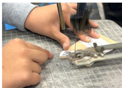
鳥の切り抜き作り

加工した丸板に、電熱ペンや塗料で彩色した自作の鳥の切り抜きを貼り付けて「オリジナルバードコール」の完成です！