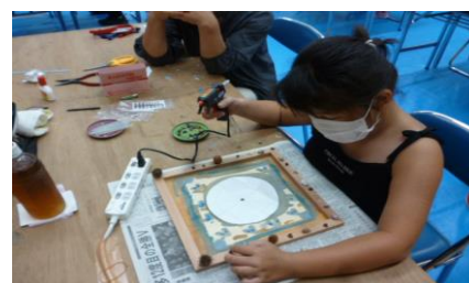
枠板に木の実を装飾