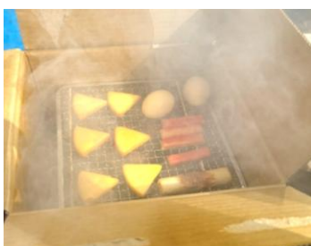
スモークウッドで温燻