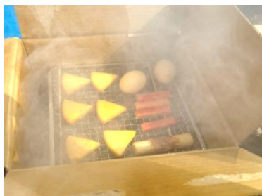
スモークウッドで温燻