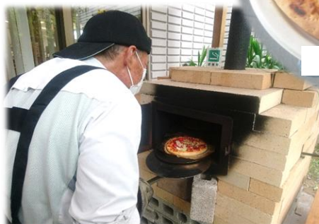
焼き(レンガ造りの窯)